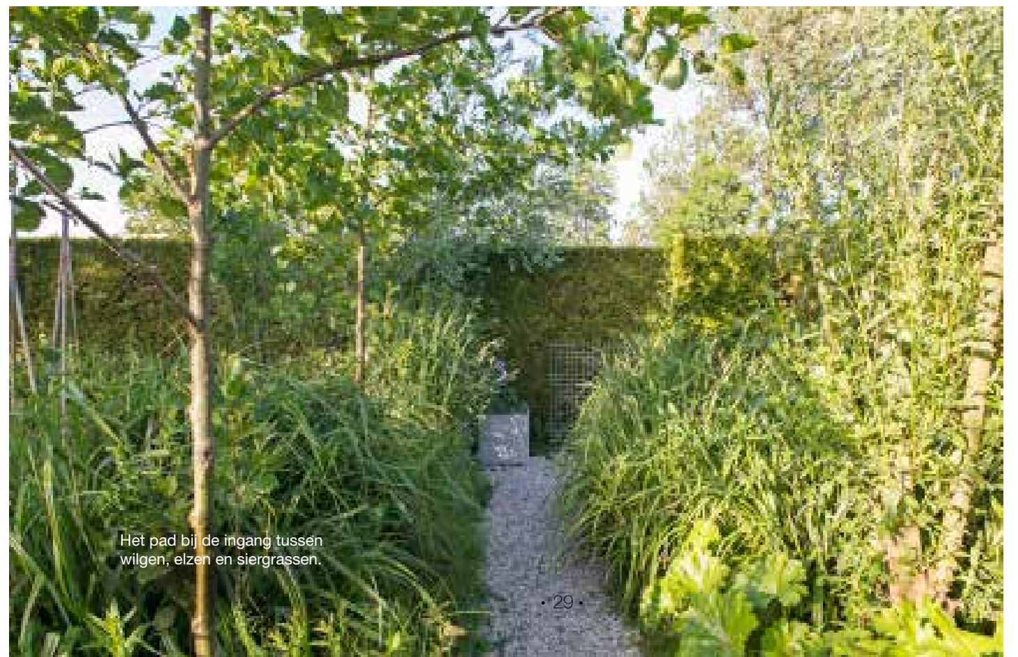
Het pad bij de ingang tussen wilgen, elzen en siergrassen.

'LANGS LANGE LIJNEN kun je je veel wildernis permitteren, het effect blijft rustig. Als dan ergens onkruid opkomt, stoor je je daar minder aan'