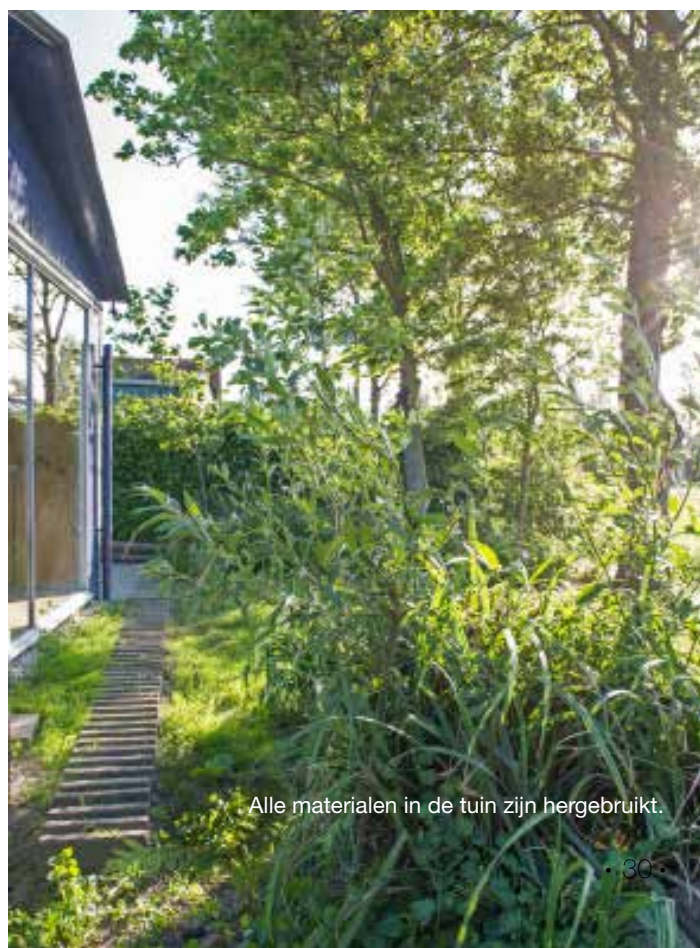
Alle materialen in de tuin zijn hergebruikt.

van een tuin komt volgens mij omdat ze de natuur proberen te beheersen'