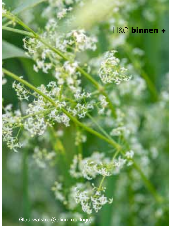
Glad walstro (Galium mollugo).