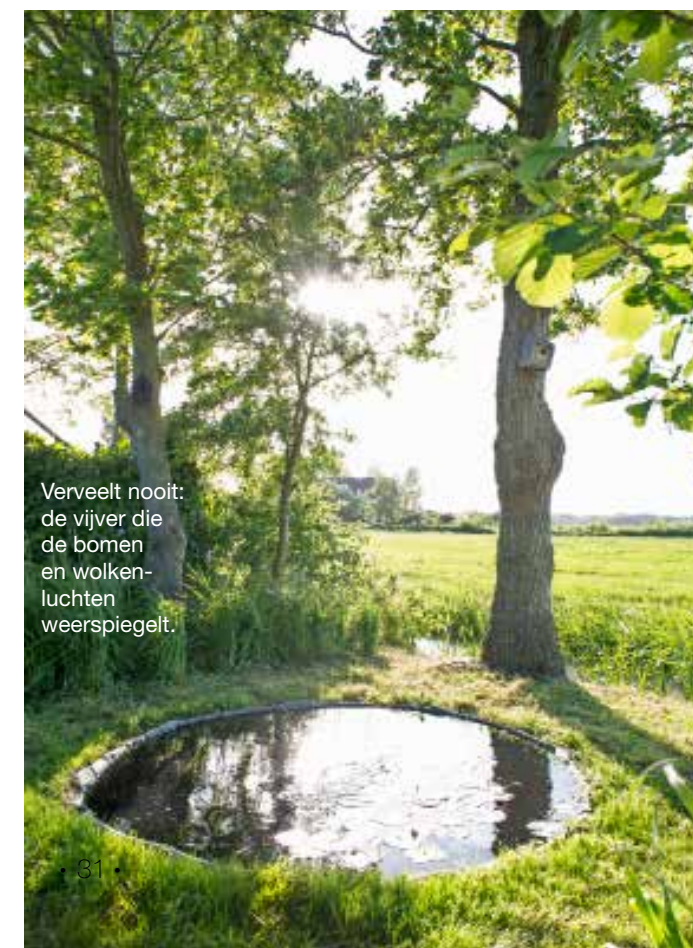
Verveelt nooit: de vijver die de bomen en wolkenluchten weerspiegelt.