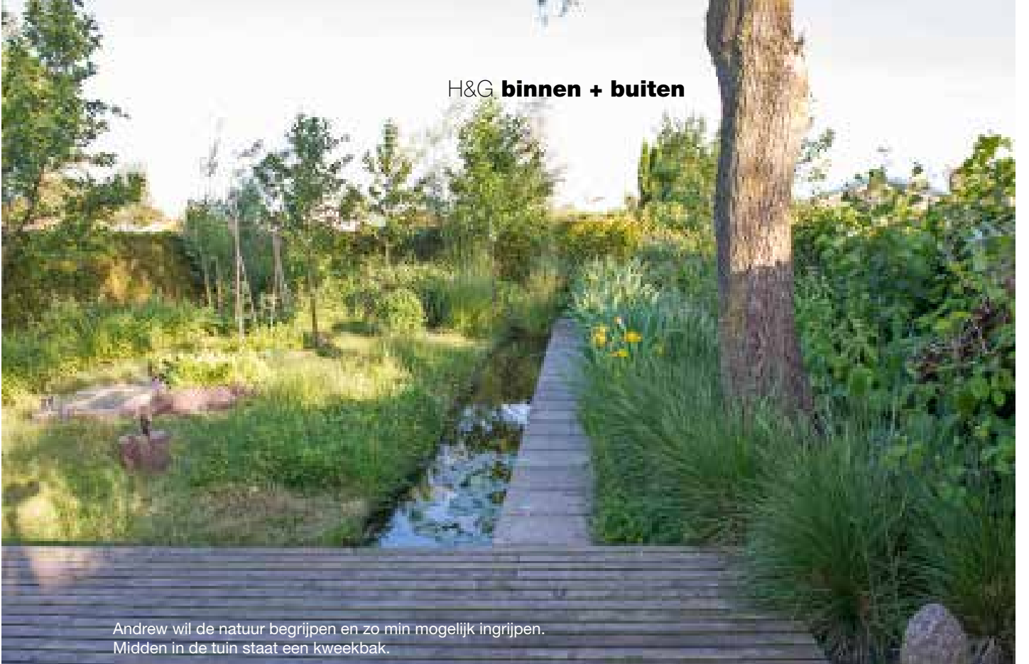
Andrew wil de natuur begrijpen en zo min mogelijk ingrijpen. Midden in de tuin staat een kweekbak.

'LANGS LANGE LIJNEN kun je je veel wildernis permitteren, het effect blijft rustig. Als dan ergens onkruid opkomt, stoor je je daar minder aan'