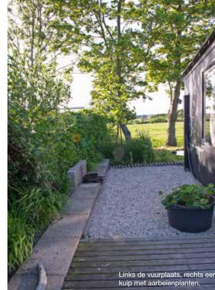
Links de vuurplaats, rechts een kuip met aarbeienplanten.

'LAAT JE VERRASSEN.' Dat mensen opkijken tegen het onderhouden