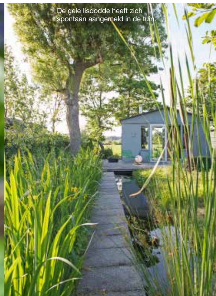
De gele lisdodde heeft zich spontaan aangemeld in de tuin.