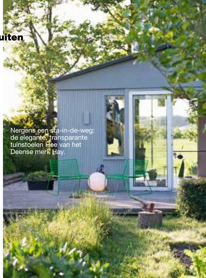
Nergens een sta-in-de-weg: de elegante, transparante tuinstoelen Hee van het Deense merk Hay.