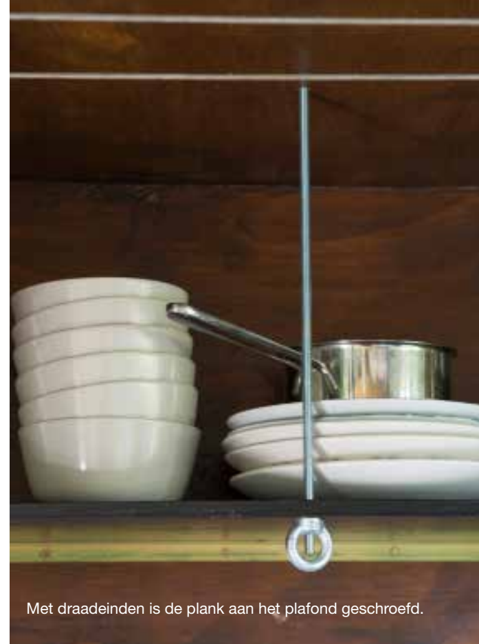
Met draadeinden is de plank aan het plafond geschroefd.